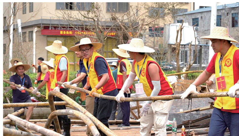
湛江市直机关先锋队队员在徐闻开展道路清障保通工作

战一场风雨，是一场大考，也是一张答卷。在雷州半岛这片热土，昔有日食工地、夜宿山岗、战天斗地、建库开河的奋斗故事，今有自带干粮、自备工具、战风斗雨、救灾复产的实践作为，湛江市直机关党员干部大力弘扬雷州青年运河“为民、担当、奋斗、廉洁”精神，在抗击超强台风“摩羯”这场硬仗中，勇毅担当、共克时艰，挺起坚韧脊梁，用实际行动践行着人民至上、生命至上的初心使命。