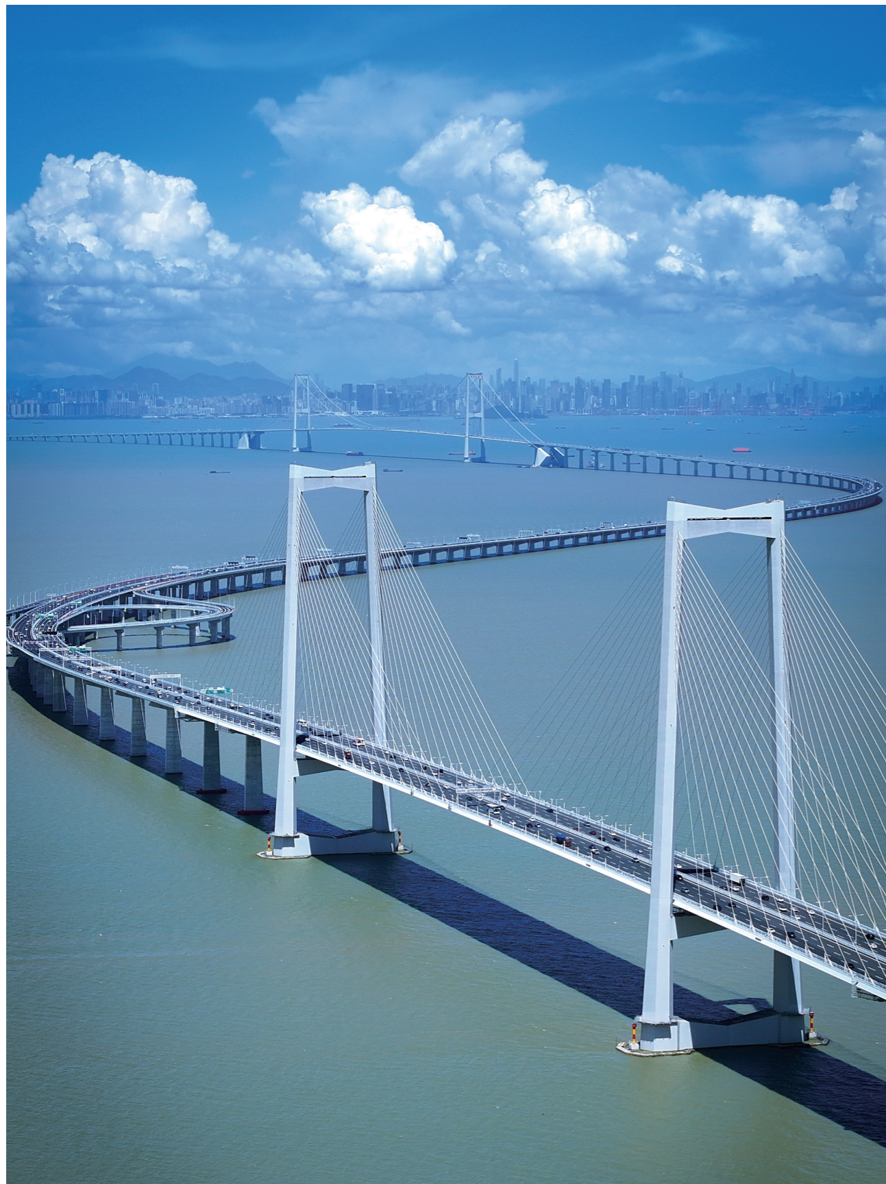
《世界湾区 深中同城》