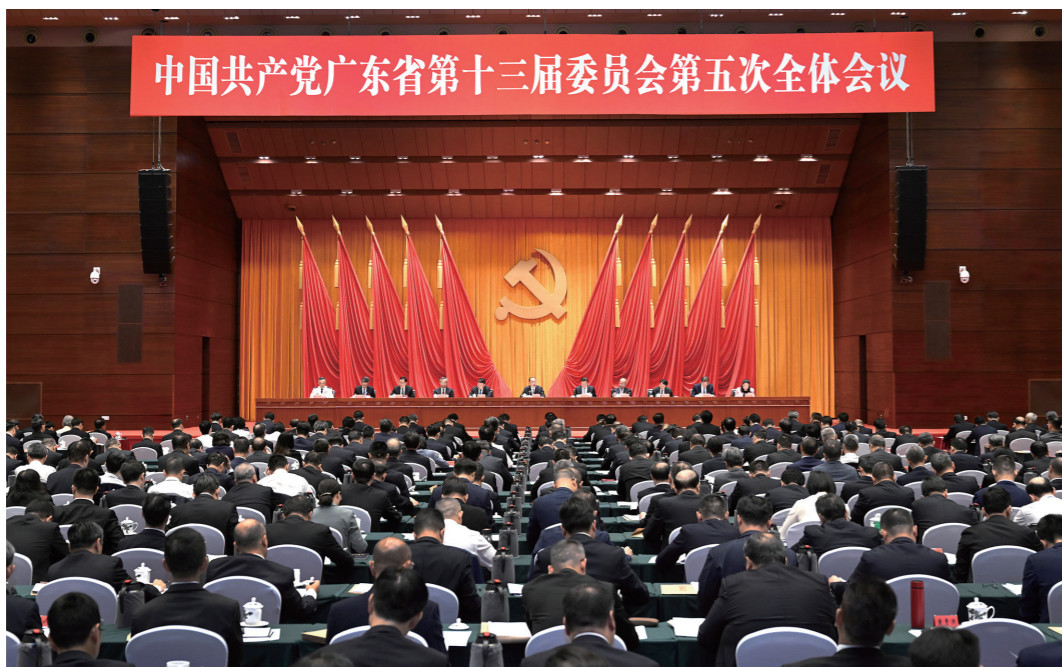
9月13日，中国共产党广东省第十三届委员会第五次全体会议在广州召开。

9月13日，中国共产党广东省第十三届委员会第五次全体会议在广州召开。会议以习近平新时代中国特色社会主义思想为指导，深入学习贯彻党的二十届三中全会和二十届二中全会、二十届三中全会精神，全面贯彻落实习近平总书记关于全面深化改革的重