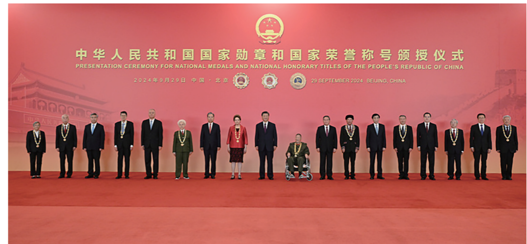
9月29日，中华人民共和国国家勋章和国家荣誉称号颁授仪式在北京人民大会堂金色大厅隆重举行。习近平等领导同志同国家勋章和国家荣誉称号获得者合影留念。