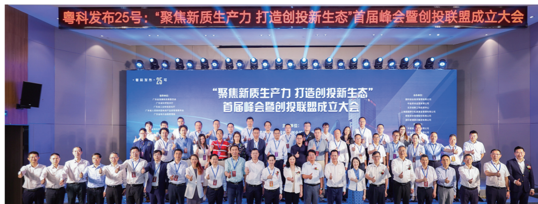
“粤科发布”25号：“聚焦新质生产力 打造创投新生态”首届峰会暨创投联盟成立大会

省国资委深入学习贯彻习近平总书记关于科技创新和发展新质生产力的重要论述，认真学习贯彻党的二十大和二十届二中、三中全会精神，围绕落实省委“1310”具体部署，强化国有企业科技创新主体地位，以国企改革深化提升行动为重要抓手，优化创新资源配置，围绕粤港澳大湾区国际科技创新中心建设布局，加快构建龙头企业牵头、科研院所、高等院校支撑、科技金融平台等创新主体相互协同的创新体系，提升科技成果转化质效。2023年度省属企业共有3项科技成果获评广东省科技进步一等奖，9项科技成果获评省科技进步二等奖。