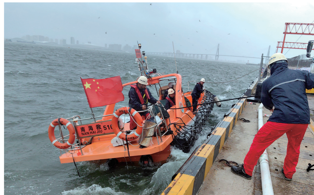
应急队队员紧急转移渔民

在惊涛中逆行，在骇浪上奋战，在黑夜里坚守……今年第11号超强台风“摩羯”于9月6日先后在海南省文昌市、广东省徐闻县登陆，海南、广东、广西等地遭受严重灾害。连日来，交通运输部南海救助局（以下简称“南海救助局”）各级党组织和广大党员积极发挥战斗堡垒作用和先锋模范作用，闻令而动、听令而行，积极投身防台抢险救援大战中，全力兜牢海上人民群众生命财产安全防线，在“风雨大考”中交出“逆行担当”的硬核答卷。