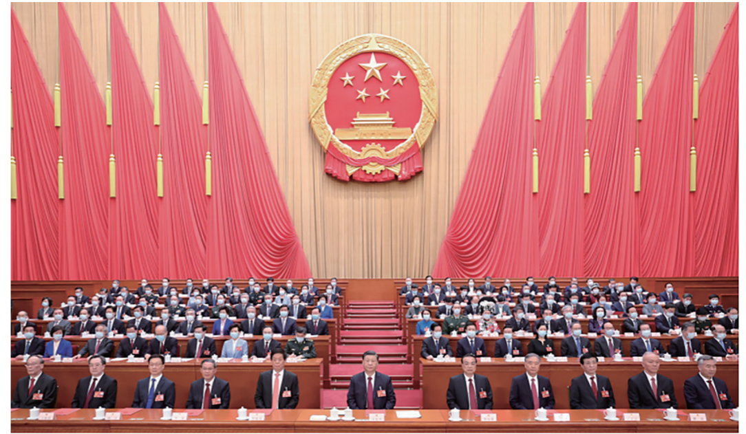
3月13日，第十四届全国人民代表大会第一次会议在北京人民大会堂闭幕。习近平等党和国家领导人在主席台就座。

■ 从现在起到本世纪中叶，全面建成社会主义现代化强国、全面推进中华民族伟大复兴，是全党全国人民的中心任务。强国建设、民族复兴的接力棒，历史地落在我们这一代人身上。我们要按照党的二十大的战略部署，坚持统筹推进“五位一体”总体布局、协调推进“四个全面”战略布局，加快推进中国式现代化建设，团结奋斗，开拓创新，在新征程上作出无负时代、无负历史、无负人民的业绩，为推进强国建设、民族复兴作出我们这一代人的应有贡献