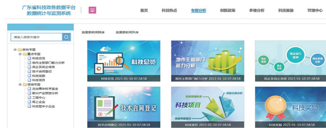
广东省科技政务数据平台数据统计与监测系统

党的二十大报告强调，深入实施科教兴国战略、人才强国战略、创新驱动发展战略，开辟发展新领域新赛道，不断塑造发展新动能新优势。针对各业务、系统、数据的壁垒未完全打破，跨部门、跨层级协同管理和需求不足等问题，广东省科技创新监测研究中心在省科技厅党组领导下，自觉将党建融入到创新科技数据共享模式工作中进行思考、谋划和推进，构建“1+1+1”数据共享新模式，打破“数据壁垒”、连通“信息孤岛”，推进数据跨部门、跨层级、跨地区汇聚融合和深度利用，赋能科技创新管理，提升跨部门协同治理能力，为高水平谋划推进科技创新强省提供有力支撑。