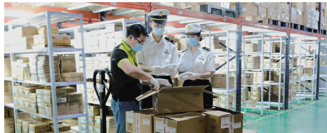
创新“港仓内移”保税物流进口模式，助力企业实现“零库存经营”

“1+1+1”数据共享新模式，实现对全省科技资源状态的态势感知、形势分析预判，有效提高我省科技主管部门管理决策水平；为全省56.66万名科研工作者提供“四少一快”“无纸化”“免填写”“零跑动”等服务，为广大科技工作者“松绑”“减负”。截至2022年底，“1+1+1”数据共享新模式已推广应用至全省9个地市科技主管部门，得到政府、行业、社会的高度认可，成为全省乃至全国数据共享“新样板”，赋能科技创新强省和粤港澳大湾区建设。跨